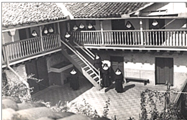
Patio interior del Claustro del Colegio de San Germán en Santiago de Cuba

convento, por lo cual exigió el expediente de fundación, que estaba en poder de M. Antonia, en Tremp. Finalmente, lo que se había iniciado como mala voluntad hacia las Madres concluyó con el reconocimiento oficial del convento, por parte del mismo capitán General y el Ayuntamiento, como Centro de enseñanza, libre de contribuciones, al igual que los demás Centros