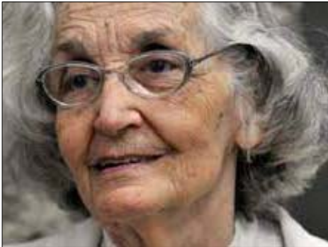
Fina García Marruz , Josefina García-Marruz Badía (La Habana, 1923-2022)

Yo para siempre y solamente lluvia, almacenando pobres amistades, sombríos tesoros, hasta que llegue la muerte a mi memoria y se lo lleve todo.