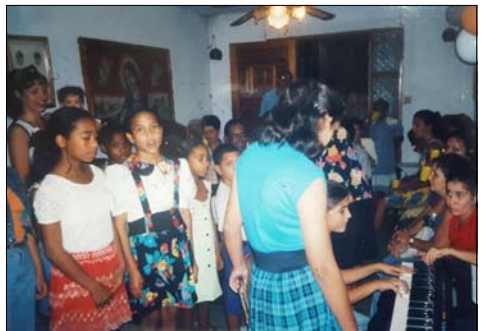
Comunidad inicial de Ntra. Sra. de Belén