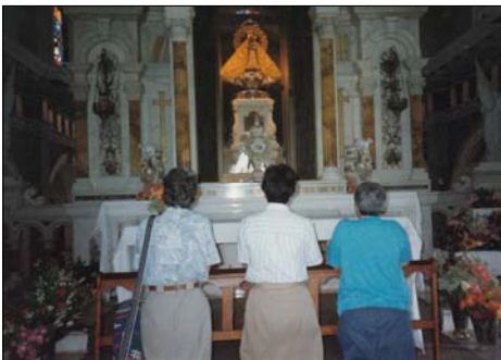
...a los pies de la Virgen, iniciamos todo

Los recuerdos que guardan con recelo quienes vivieron aquella etapa son muchos pues fueron acompañados por muchísimos sacerdotes, obispos y religiosas. Era la primera vez que se hablaba de Dios en esa zona tan habitada y en la que abundaba la religiosidad popular. Desde sus inicios fue una comunidad misionera, no solo en el área donde estaban ubicados los apartamentos, sino que, en compañía de las hermanas armaban el camión misionero y cada semana los más jóvenes y algunos mayores iban a las comunidades del municipio Guamá ubicado al oeste de la provincia: allí también fundaron comunidades, iniciaron sacramentalmente a muchas personas y hasta el día de hoy regresan a compartir la Palabra de Dios, no las mismas personas, pero sí con la misma intención.