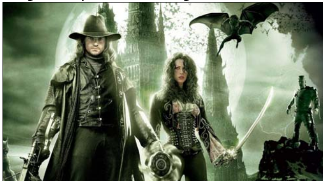
Imagen de la película Van Helsing

comunidad, tienen un mismo origen, puesto que Dios hizo habitar a todo el género humano sobre toda la haz de la tierra, y tienen también un fin último, que es Dios, cuya providencia, manifestación de bondad y designios de salvación se extienden a todos, hasta que se unan los elegidos en la Ciudad Santa que será iluminada por el resplandor de Dios y en la que los pueblos caminarán bajo su luz.