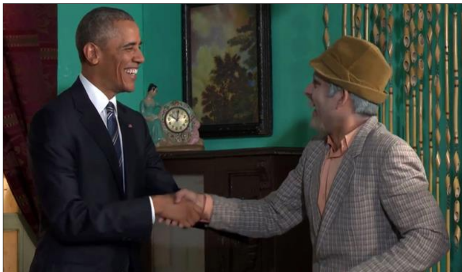
Vivir del cuento... Pánfilo y el Presidente Obama

Más allá de la visita y del discurso que tantas reacciones y respuestas contrapuestas provocara por lo que el Presidente Obama dijo o no dijo, lo que propuso cambiar u olvidar, lo que reconoció o dejó en las sombras, es instante propicio para la esperanza desde la certeza que "El futuro de Cuba tiene que estar en las manos del pueblo cubano", no por la afirmación del ilustre visitante, sino por el deseo y empuje de toda la nación.