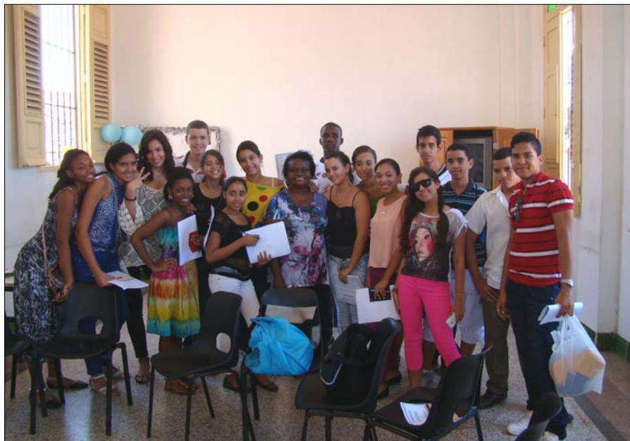
El bellissimo grupo de adolescentes que culminó este curso su andar en La Salle

Cada curso ha tenido la impronta que dejan los grupos y en cada uno de estos grupos está la huella individual de sus integrantes. Los hay muy buenos y motivados, pero también han estado los que no les ha interesado la propuesta y van obligados, o aquellos que se rebelan a su manera porque son los padres los que quieren que estén y a ellos "no les importa". Algunos ganan la batalla con