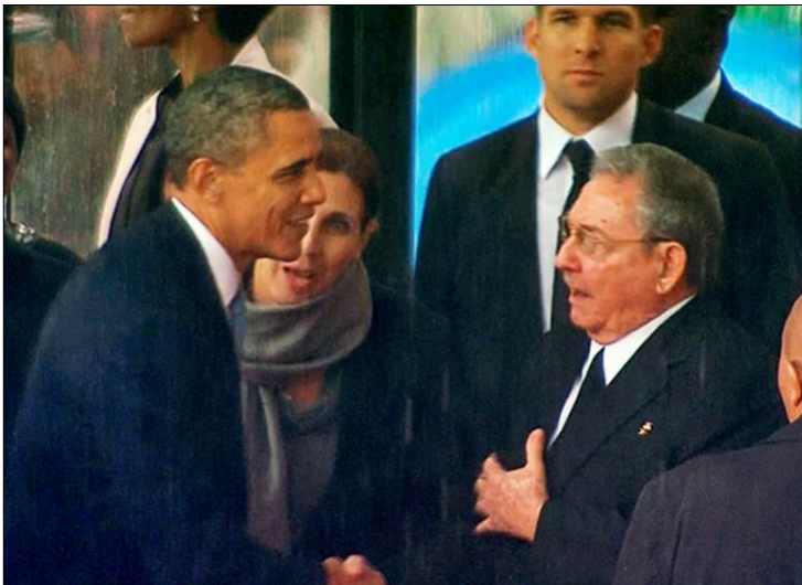
Saludo de los presidentes Raúl Castro y Barack Obama, en las honras fúnebres de Nelson Mandela en diciembre de 2013

Para Juan Pablo II era evidente que el aisla-