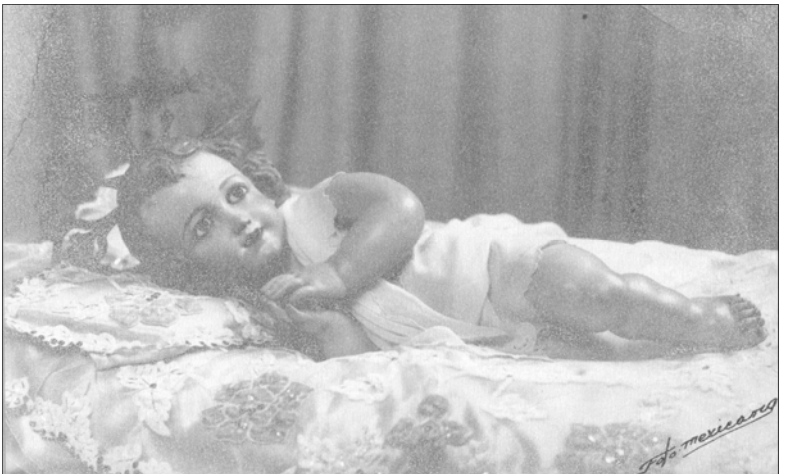
Niño Jesús. Escuela española. Talla en madera policromada de la primera mitad del siglo XVIII Perteneció al antiguo Santuario de Nuestra Señora de los Dolores

Esta estrella de la que estoy hablando, bien podríamos encontrarla en su Palabra contenida en las Sagradas Escrituras, ¡qué bueno sería que durante estos benditos días de Navidad leyéramos en la Biblia las profecías de Isaías en lo que se refiere a la venida del Mesías, o en los cuatro