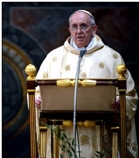
Arriba el papa Francisco durante la homilía. Debajo un momento de la celebración Eucarística en el interior de la Capilla Sixtina.

Edificar. Edificar la Iglesia, se habla de piedras: las piedras tienen consistencia; las piedras vivas, piedras unguadas por el Espíritu Santo. Edificar la Iglesia, la esposa de Cristo, sobre aquella piedra angular que el mismo Señor, y con otro movimiento de nuestra vida, edificar.