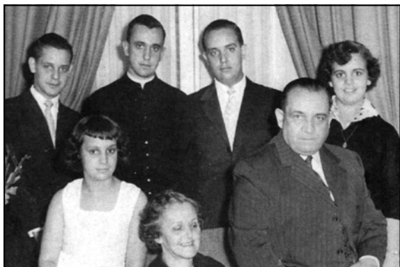
Foto familiar, con sus padres y hermanos

No solía conceder entrevistas por lo que los periodistas tomaban sus declaraciones de las homilias. Se enfrentó fuertemente con las autoridades locales en temas como aborto, matrimonio homosexual y liberali-