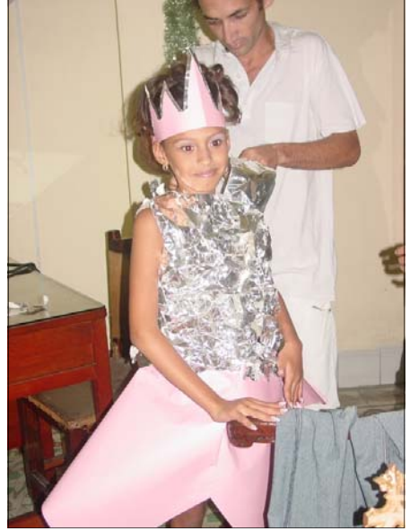
pensando hacer el vestuario DE PAPEL y MATERIALES RECICLADOS.

Con el paso de los días y mi insistencia por tener una idea clara de lo que se haría, comenzamos los ensayos en mi casa, pero todo era cada vez más complicado. Una de esas noches, sacando cuenta del tiempo y lo que faltaba por coordinar, pregunté a la joven directora si había pensado que no teníamos ropa para los improvisados actores a lo que ella tranquilamente me respondió: estoy