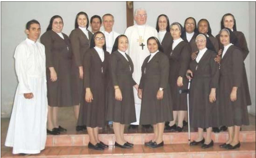
Regreso a Santiago, 5 de agosto de 2011

Ciento treinta y cinco años después las Hermanas de la Caridad del Cardenal Sancha regresaron a Santiago de Cuba, el 5 de Agosto de 2011, al celebrarse el 142 aniversario de la fundación de la Congregación, fueron