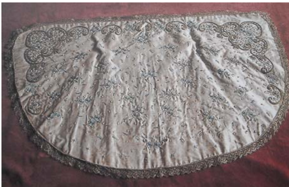
Mantón de las lágrimas de las madres cubanas

A la Virgen de la Caridad del Cobre: Reina, Madre y Patrona de todos los cubanos, sin privilegios, ni distinciones, pues todos somos sus hijos muy queridos, le pedimos desde lo más hondo de nuestro corazón que sea siempre su bendito y pequeño mantón el que nos ampare y cobije como pueblo y como iglesia que peregrina en Cuba, para que se cumpla siempre el hermoso lema: A Jesús por María. La Caridad nos une.