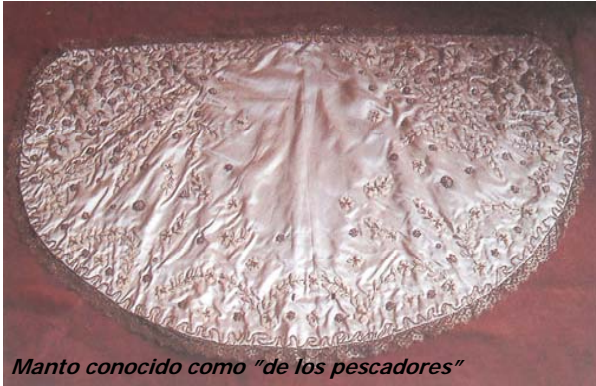
Mantón conocido como "de los pescadores"

ofrendara su vida durante al lucha insurreccional contra la tiranía de Fulgencio Batista, confeccionado y donado por madres que habían perdido a sus hijos en la contienda.