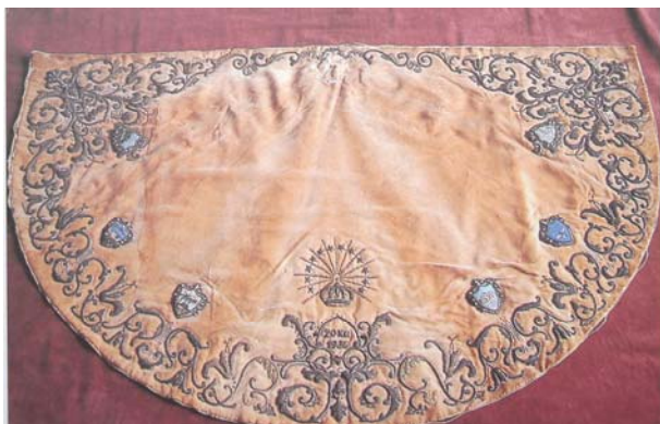
Manto de la Coronación Canónica de 1936

De especial mención es el manto que vistió para la Coronación Canónica en el año 1936, es de pana amarilla y