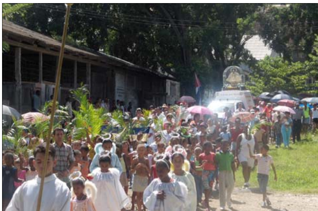
Procesión al recibir a la Virgen en Chile

No menos impresionante fu el regreso de la Virgen Peregrina del pueblo de Dos Caminos, que escoltada por el carro en que se trasladaban los sacerdotes que celebraron allí, seguida por el jeep de la parroquia con parte de los seminaristas y la camioneta de sanluiseros que no la dejaban viajar sola, repletó las aceras, primero del Reparto Pastorita, de