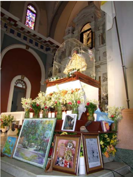
Ofrendas de las provincias cubanas a la Virgen

Será también la oportunidad para las personas que han hecho alguna promesa a la Virgen y, o porque son mayores o enfermas, están imposibilitadas a ir al Cobre, puedan cumplir su promesa delante de la Virgen Peregrina, con la disposición de ir al Cobre si las condiciones que le impiden cum-