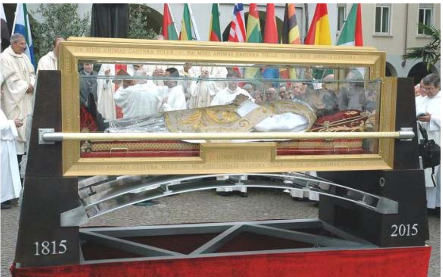
Urna de Don Bosco

San Juan Bosco ha fascinado a múltiples generaciones de jóvenes, de familias, porque ha llevado adelante un proyecto de amor, ha sido signo y portador del amor de Dios especialmente a los jóvenes más pobres y necesitados. Por eso la iglesia lo aclama como santo: SAN JUAN BOSCO, PADRE Y MAESTRO DE LA JUVENTUD.