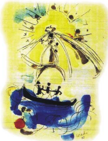
Acuarela P. Miguel A. Loredo

Y fluye inagotable de la alcuza de nuevo a modelar la pierna rota... A nutrir la sonámbula lechuza.