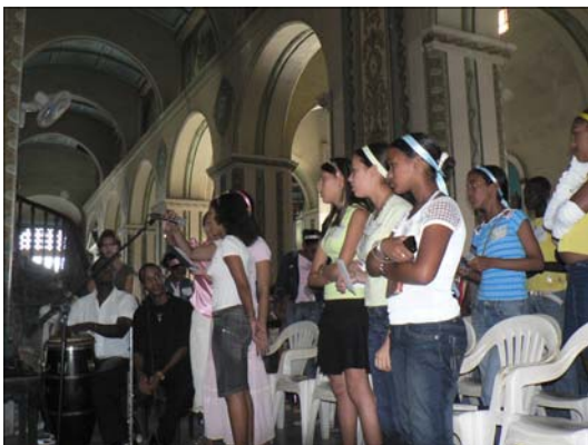
Coro de jóvenes de la comunidad de San Francisco Javier