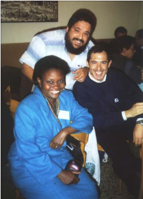
El día del encuentro en Roma, año 2000

Estoy segura que todos los que le han conocido tendrán su propia historia en primera persona. En mi caso, hay varias, pero la que hoy viene a mi con mas fuerza, me hace volar ahora mismo hasta Roma, durante el Jubileo de los Laicos en el año 2000, un 26 de noviembre, Fiesta de Cristo Rey . Al terminar la multitudi-