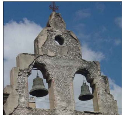
Campanario del templo de San Luis Obispo