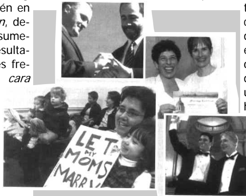
Cosas veredes Mio Cid

Si miramos la “ecuación” que encabeza estas líneas desde un estricto punto de vista matemático enseguida diríamos que el signo está errado, que eso es una «inecuación». Pero en la vida no todo es matemáticas, y el mismo Einstein decía: «En la medida en que las leyes de la matemática se refieren a la realidad no son ciertas, y en la medida en que son ciertas no se refieren a la realidad»; sentencia que tal vez no agrade mucho a algunos matemáticos, pero que sin lugar a dudas es verdadera. También en el caso de nuestra ecuación , depende de los factores que sumemos el tener uno u otro resultado. En el habla cotidiana es frecuente llamar al cónyuge cara mitad o media naranja , expresiones vulgares que nos plasman —con la chispa de la insondable sabiduría popular— que la unión marital de dos personas da por resultado una sola cuando se trata de hombre y mujer .