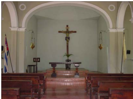
Vista interior del templo y altar

Allí ubicado en el lado norte del céntrico parque de El Caney está erguido, sobre roca firme, desde hace tres siglos y medio nuestro bello y majestuoso templo. Desde allí ha sido testigo de la vida, la historia y la cultura del poblado de las frutas. Desde allí ha dado amparo a sus hijos, y a los de la cercana ciudad de Santiago, en tiempos de tempestades, terremotos y guerras. Bajo su techo, pobladores y visitantes, han encontrado y encuentran en él la presencia divina de Dios Padre, Hijo y Espíritu Santo.